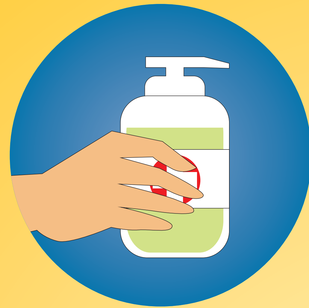
clean & disinfect