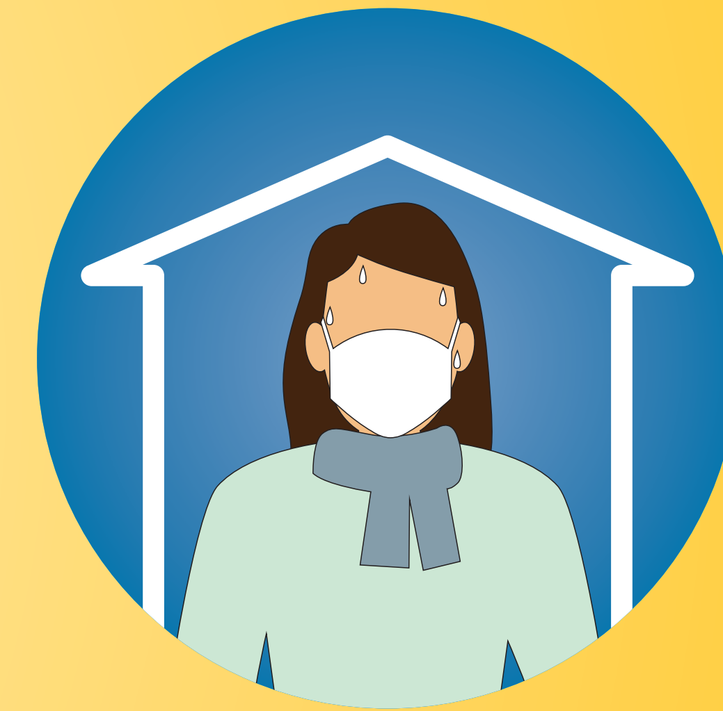
stay home if your sick