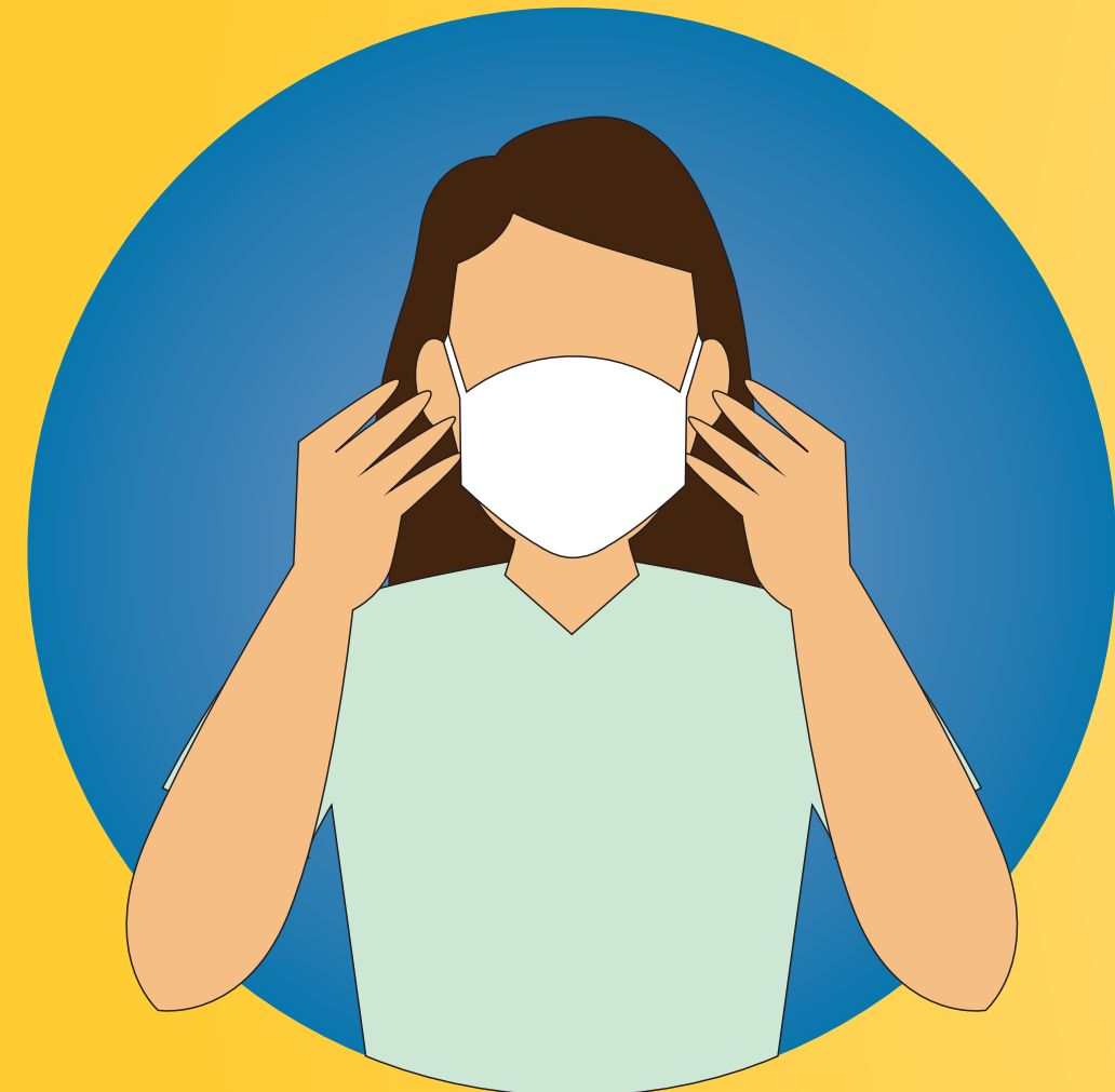
use face mask