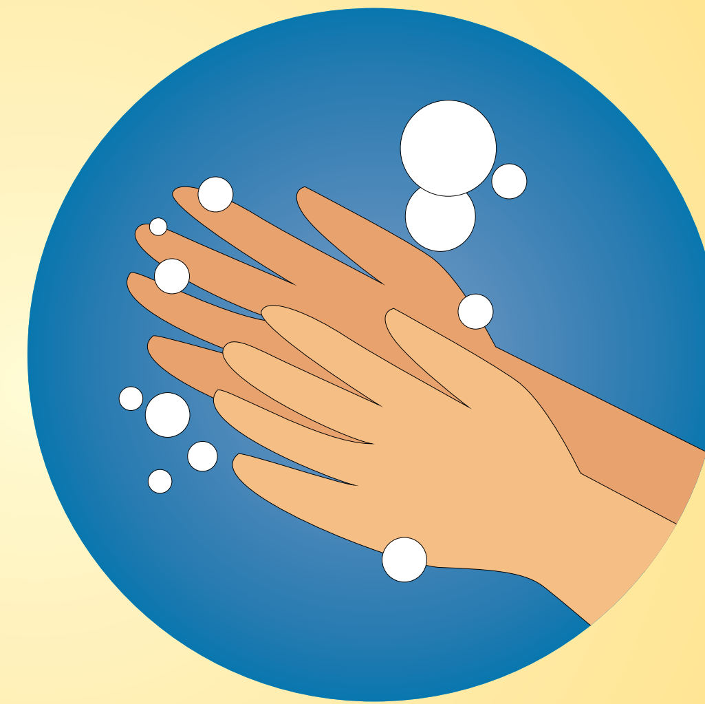
wash hands frequently