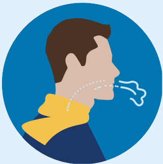
Dificultad para respirar