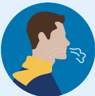
Dificultad para respirar