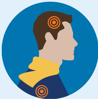
Dolor de Cabeza/ Cuerpo

Los síntomas pueden aparecer de 2-14 días después de la exposición al virus.