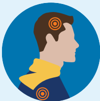
Dolor de Cabeza/Cuerpo

Para obtener información general y recursos sobre el virus, llame al: 909-387-3911 o visite SBCOVID19.com